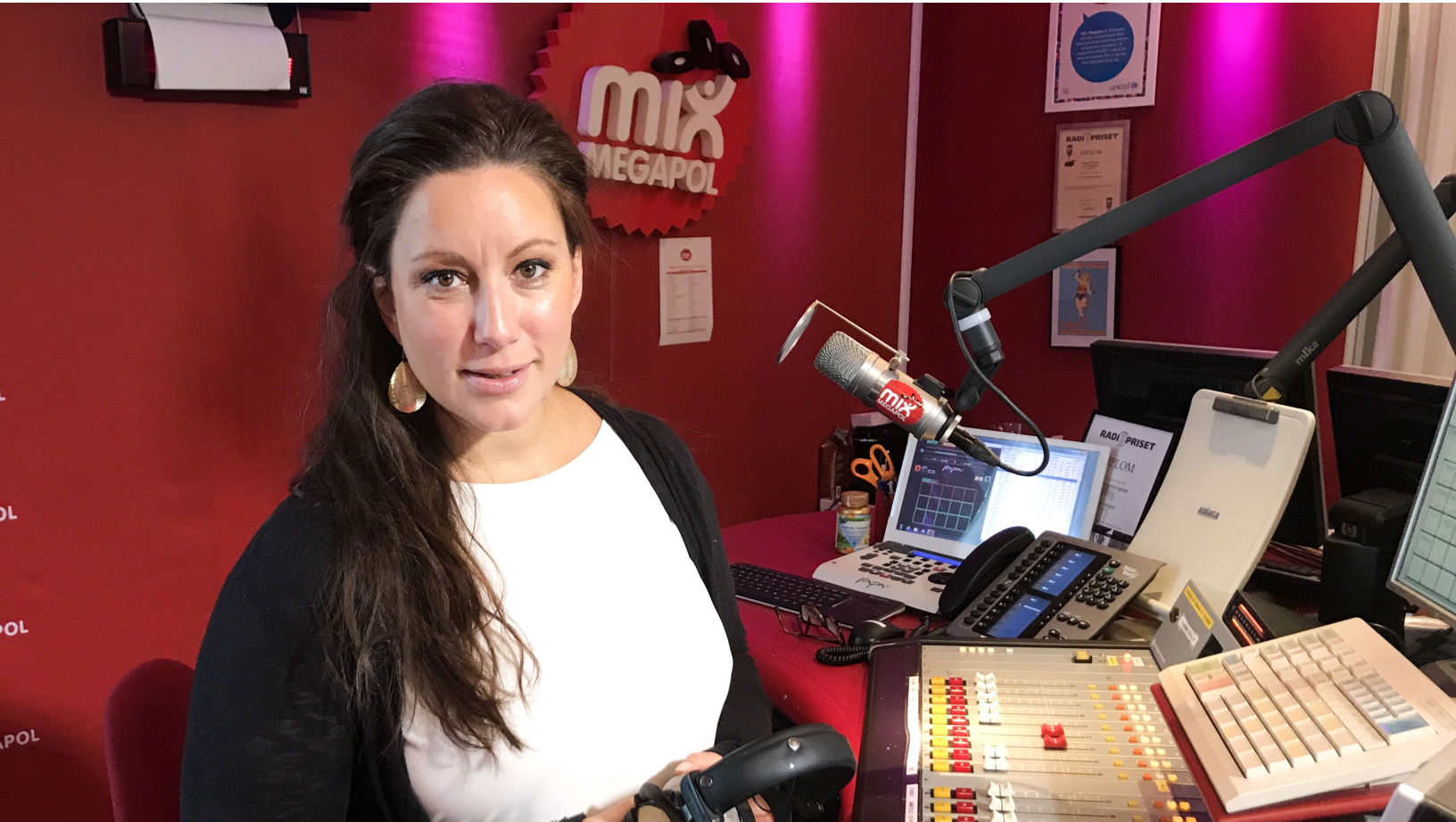
Lisa Nilsson på plats i Mix Megapol-studion