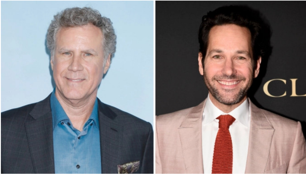
Will Ferrell och Paul Rudd

sålde Hekta På Tur fler fjälldukar i april 2020 än under hela 2019. På sab.se kan du läsa mer.